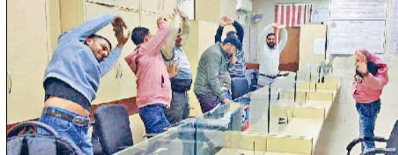
रेवाड़ी। सचिवालय में वॉर्ड ब्रेक के दौरान योग करते कर्मचारीगण।

आयुष विभाग द्वारा कार्यस्थल पर माहौल को अनुकूल बनाने और अधिकारियों-कर्मचारियों को तनाव मुक्त रह कर कार्यक्षमता बढ़ाने का उद्देश्य से हवाई-ब्रेकहू देने का निर्णय लिया गया है। वॉर्ड-ब्रेक यानी योग के लिए ब्रेक कार्यदिवस में पांच मिनट के लिए होगा। डीसी अभिषेक मीणा ने बताया कि सरकार द्वारा अधिकारियों-कर्मचारियों को अब कार्यस्थल पर प्रत्येक कार्यदिवस पर कुछ ऐसी क्रियाएं और सरल योग के आसन