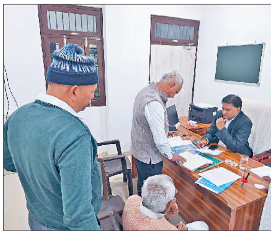
कनीना। जन स्वास्थ्य एवं अभियंत्रिकी विभाग कार्यालय में सीएम पलाइंग टीम। मशीन खराब पाई गई। सफाई का बुरा हाल था। जहां पर लीकेज गंदे पानी को सफाई करता हुआ पाया गया। एसडीई कार्यालय पब्लिक हेल्थ कनीना के दस्तावेजों को खंगाला गया। जिनमें अनेक