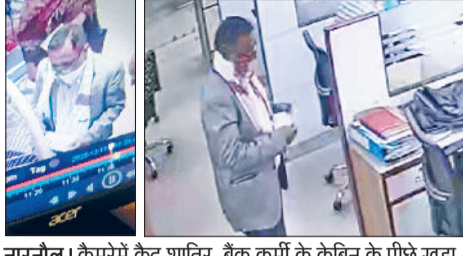
नारनौल। केमरेमें केंद्र शातिर, बैंक कर्मी के केबिन के पीछे खड़ा दिखाई दे रहा शातिर।

करीब 50 साल का दिखने वाला अच्छा खासे सूटबुट पहने व्यक्ति बैठा था। इसी व्यक्ति ने बैंक कर्मी बन बुजुर्ग की पासबुक अपडेट करवाने और दरखास्त लिखने को कहा। बुजुर्ग सीट पर बैठे होने की वजह और बैंक कर्मी की तरह की सहायता करने का तरीका देख असल बैंक कर्मी समझ गया और उसके हाथों में तीन लाख थमा दिए। शातिर यह तीन लाख लेकर रफूचककर हो गया। अब जब मामला पुलिस तक पहुंचा और सीसीटीवी फुटेज खगाली तो पीड़ित के परिजन व पुलिस भी हैरानी थी कि शातिर फर्जी बैंक कर्मी बन असल बैंक कर्मचारियों के सामने ही बुजुर्ग ग्राहक से पैसा लेकर फरार हो गया।