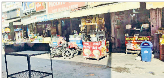
रेवाड़ी। रेलवे रोड पर दुकानों के बाहर रखा गया सामान व मोती चौक के पास अतिक्रमण के कारण लगी लोगों की भीड़।