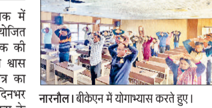
नारनौल। बीकैपन में योगाभ्यास करते हुए।