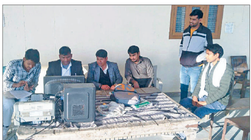
नांगल चौधरी। नव स्थापित तहसील कार्यालय में वकीलों से दस्तावेज तैयार कराते आमजन।

लूटपाट की वारदातों की आशंका से व्यापारी चिंतित, डीसी को सौंपेंगे ज्ञापन