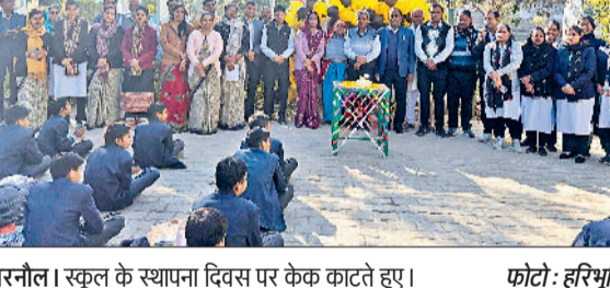
नारनौल। स्कूल के स्थापना दिवस पर केक काटते हुए।