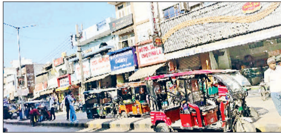
रेवाड़ी। रेलवे रोड और रेलवे स्टेशन के गेट पर खड़े ऑटो रिकशा।

रेलवे रोड एक बार फिर ऑटो चालकों की मनमानी शुरू हो गई है। रेलवे स्टेशन के मेन गेट से लेकर चौक तक मनमाने तरीके से ऑटो खड़े किए जा रहे हैं, जिससे इस रोड पर फिर से जाम जैसे हालात बनने लगे हैं। जीआरपी से लेकर सिटी पुलिस तक ऑटो चालकों के खिलाफ कोई कार्रवाई नहीं कर रही है। पुलिस ने कुछ दिनों पहले रेलवे रोड पर जाम का कारण बनने वाले ऑटो चालकों के खिलाफ सख्तों से काम लिया था। रेलवे स्टेशन के गेट से लेकर चौक तक रोड को ऑटो से खाली करा दिया था। इससे स्टेशन पर आवागमन करने वाले यात्रियों व अन्य लोगों को काफी राहत मिली थी। पुलिस की इस कार्रवाई का ऑटो चालकों ने विरोध किया था, परंतु आमजन इससे काफी राहत महसूस करने लगे थे। जिससे बीतने के साथ ही ऑटो चालकों ने एक बार फिर से वही रवैया अपनाना शुरू कर दिया है। रेलवे रोड पर बड़ी संख्या में ऑटो खड़े कर दिए जाते हैं, जिससे दूसरे वाहनों का निकलना मुश्किल बन जाता है। रेलवे चौक पर सरकुलर रोड से लेकर रेलवे स्टेशन से चलने वाले ऑटो सवारियों की होड़ में खड़े हो जाते हैं।