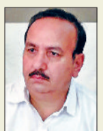
को नोटिस जारी किया गया है। उनके जवाब का इंतजार है।