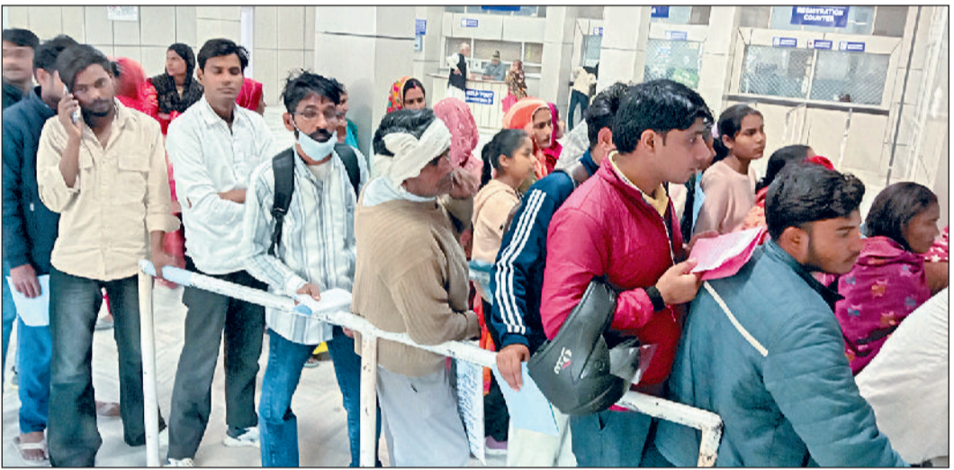
नारनौल। जिला नागरिक अस्पताल के औषधालय पर दवा लेते लोग।

सरकारी अस्पतालों में सीधे सीनियर मेडिकल ऑफिसर (एसएमओ) की भर्ती रोकने एवं पूर्व अनुमोदित संशोधित एसीपी संरचना की अधिसूचना जारी करने के मुद्दे को लेकर सरकारी रेगुलर डाक्टर पिछले चार दिनों से हड़ताल पर हैं।